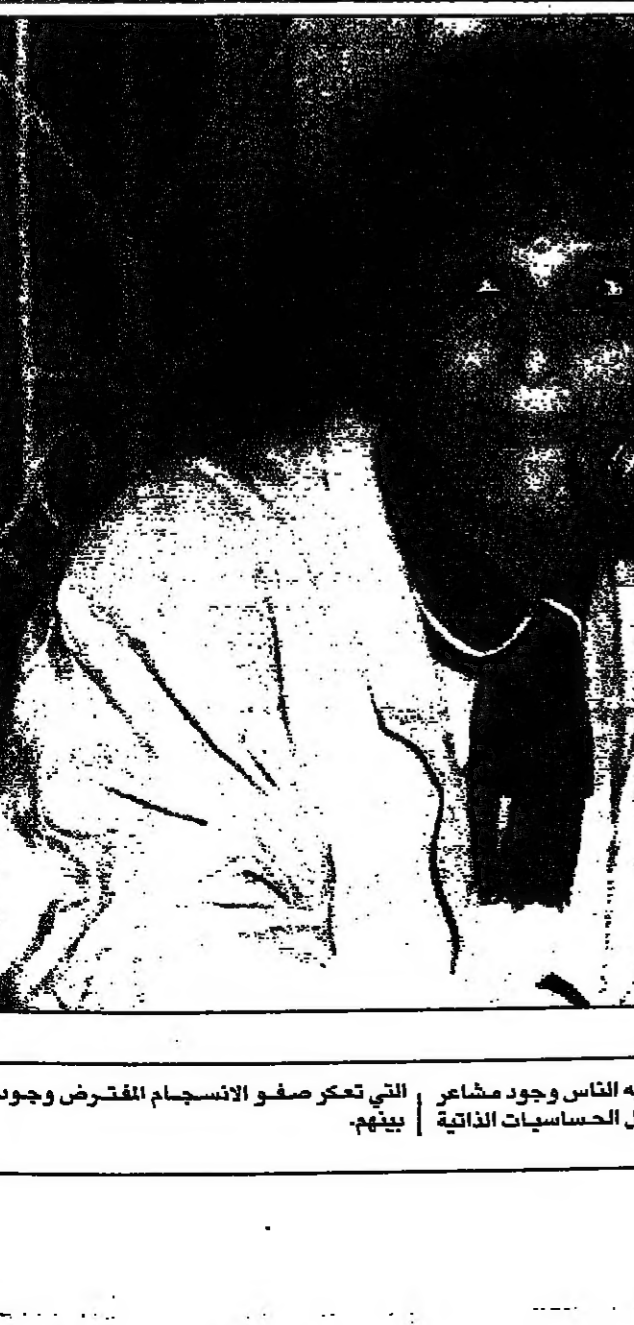
في الوقت الذي يتصور فيه الناس وجود مشاعر التي تعكس صفو الانسجام المفترض وجوده مرهفة لديهم، تترفع عن كل الحساسيات الذاتية بينهم.

9:00 القران الكريم، 9:30 مساء الخير اوريت، 10:00 مسلسل مصري، بكيزة وزغلول، 11:00 صندوق الدنيا، 12:30 برنامج عزيز حبيب، 17:30 مسرحية باي باي عرب، 18:30 برنامج كان زمان - عزيز حبيب، 17:30 فترة غنائية، 18:00 مسلسل مصري، 1:40 احلام مسرقة، 19:00 مهرجان اوريت الثاني للاغنية العربية، بيروت، 1:40 برنامج مسابقات كيسة زر، 2:30 مسلسل مصري، بكيزة وزغلول، 3:30 برنامج فيديو كليب، 4:00 مسلسل مصري، احلام مسرقة، 5:00 القران الكريم، 5:30 الختام.